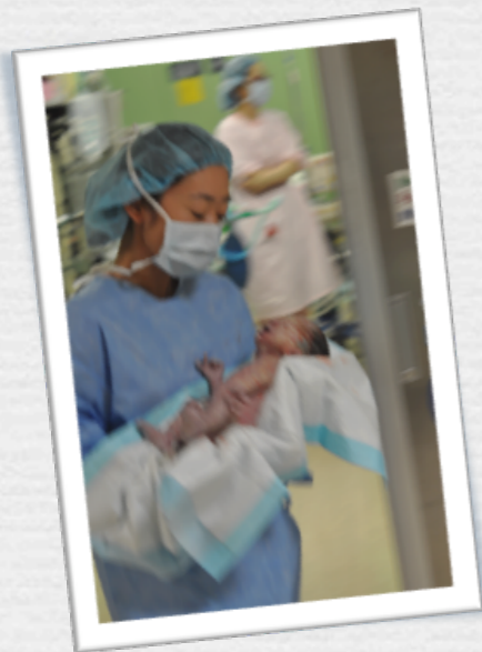
帝王切開直後、手術室やカテーテル検査室に赤ちゃんを搬送

計画的に帝王切開を行い、シミュレーションに従ってカテーテル治療や開心術を施行する。