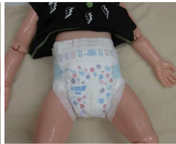
尿パットの上からオムツを履かせて 押さえ、吸収させます