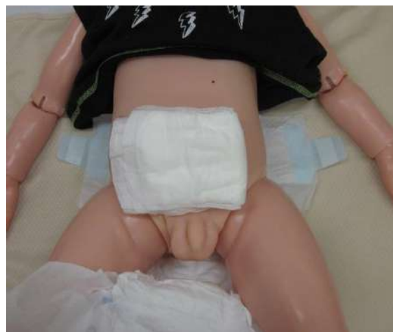
尿量に合った尿パットを当てます 写真は100cc 2つ折り