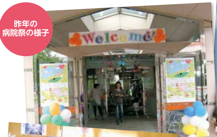
昨年の 病院祭の様子

星、宇宙をテーマにした企画を考えました。これはセイコーエプソン様のご協力により実現するものです。内容はお楽しみということで、「プラネタリウム」や「宇宙の映像と語りのコラボレーション」などを考えています。宇宙の中の私達が互いにつながっていることを感じられるような企画になるのでは…「愛と勇気と宇宙のロマン」現実をはなれて気持ちよい空間が提供できるよう頑張ります。