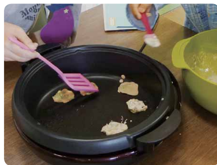
にらせんべい作りに挑戦