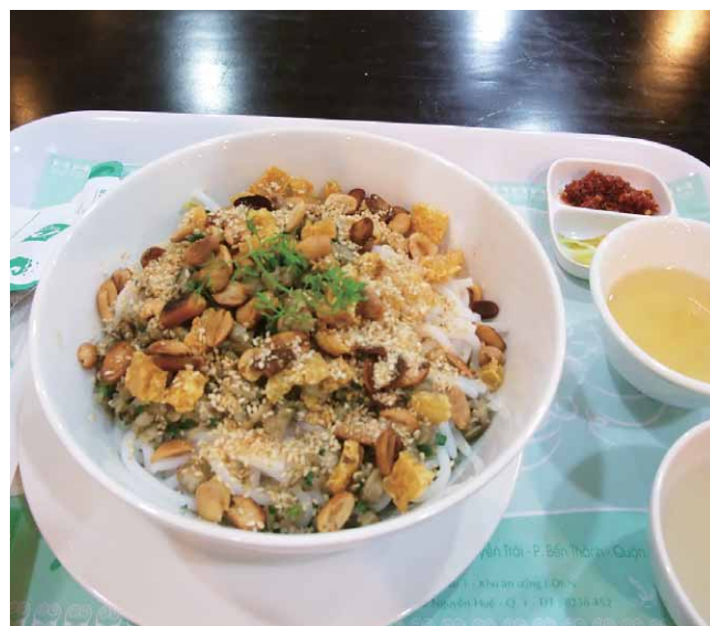
中部フエの名物、シジミの乗ったブン（米麺）