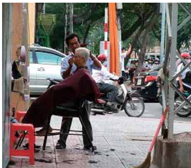
ホーチミンでよく見かける路上の床屋さん (体験したことはありません)

文化の違いなどからうまくいかないことも多々ありましたが、在越中はベトナムの人にとっても助けてもらい、エネルギーな国ならではの楽しい体験もたくさんありました。次回からどうぞお付き合いください。