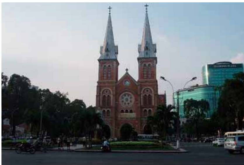
職場の近くにあったサイゴン大教会

ベトナムの人は一般的に北部の人は本音と建前を使い分け、細かい作業が得意であり、南部の人は明るくて率直、おおらかなようです。北部にある首都ハノイはこじんまりしていますが、フランス統治時代の風情ある建物が多く残る美しい街です。世界遺産のハロン湾もあります。またハノイは四季があり冬はだいぶ寒いようです（寒い時期には訪れたことはありませんが）。私が住んでいた南部のホーチミンは経済の中心です。ホーチミンにも歴史のある美しい建物がたくさんあったのですが、街の発展に伴いそれがどんどん壊されてショッピングセンターになってしまいとても残念に思っています。またベトナムの中部にはかつて