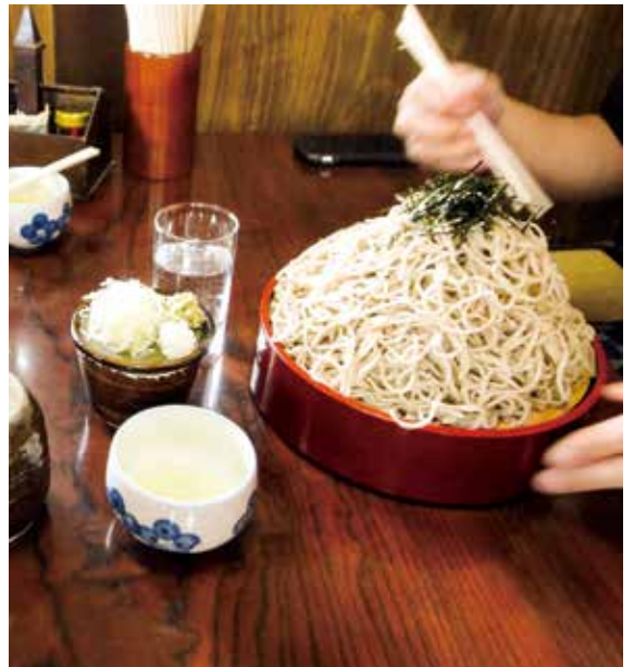
長野といえば蕎麦！（蕎麦消費率Upしました）