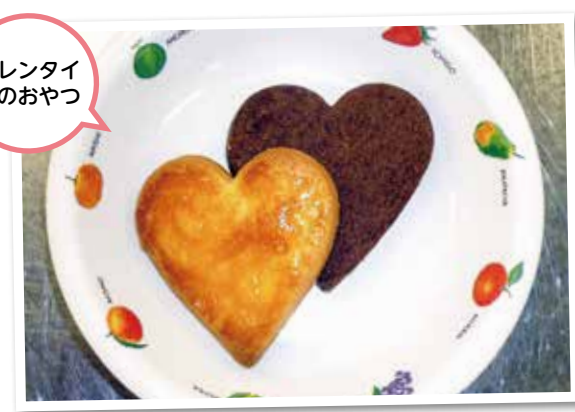
バレンタイン のおやつ