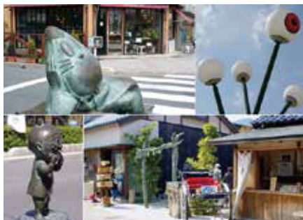
写真3 妖怪の街境港の水木しげるロード