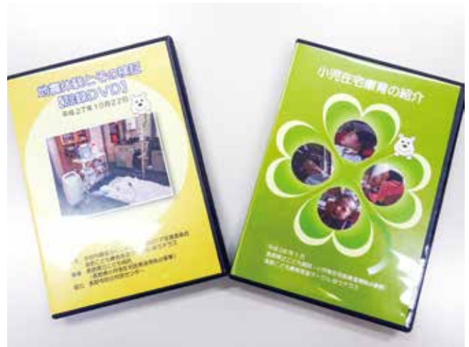
小児在宅医療の知識を深めるための学習会DVD

顔合わせや外来案内によって、初めての外来受診の不安解消ができました。また、全国で行われている小児在宅医療の情報を提供することで人材育成にも心がけています。