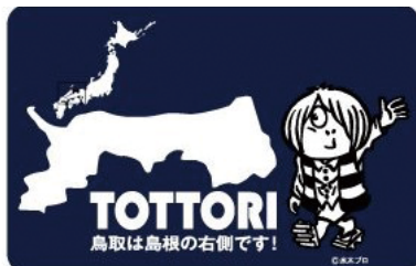
写真1 間違えないで!鳥取は右側です

ちなみに砂漠と間違えると鳥取県民は激怒しますのでご注意ください(砂丘:風によって運ばれた砂が堆積してできた丘状の地形 ↔ 砂漠:降雨量が極端に少なく、岩石や砂礫からなる広大な荒地)。