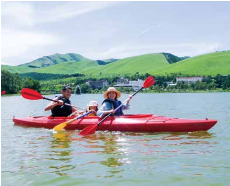
休日は家族でアウトドアを楽しんでいます@白樺湖