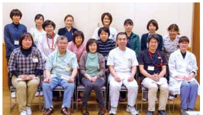
在宅医療支援チームメンバー

会議では、毎月リストアップした患者さんについて、担当医師や病棟職員から現在の病状や退院に向けた準備の進