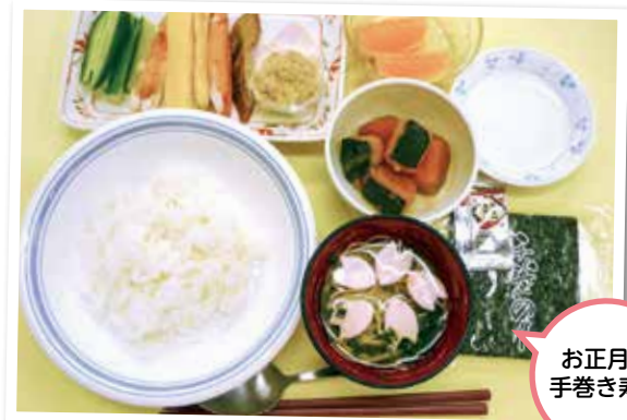
お正月の 手巻き寿司