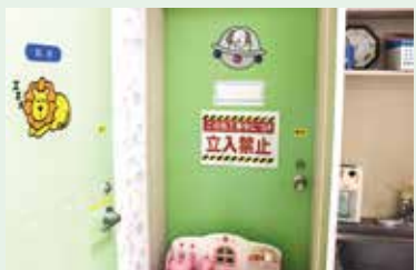
このドアの奥でファミリールームの工事が行われています。

最後になりますが、大勢の方々からのあたたかいご寄付によりこども病院にファミリールームを設置できるようになりました。この場をお借りし、厚く御礼申し上げます。これからも患者様およびそのご家族の皆様へ寄り添い、最善の医療が提供できるよう職員一同努力してまいります。