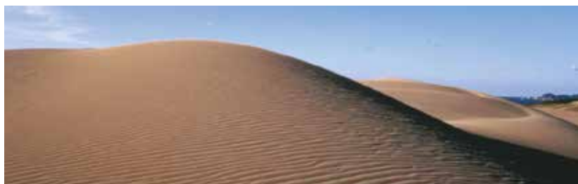
写真2 鳥取“砂丘” ← 砂漠ではない