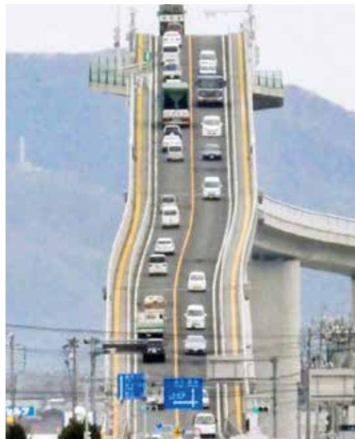
写真4 江島大橋 スゴ過ぎ…

いかがだったでしょうか。長野からは車で8-9時間と生半可な覚悟ではいけない距離ですが、少しでも興味を持っていただければ幸いです。