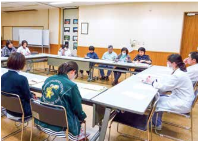
真剣に会議に参加しているメンバー

こども病院入院中に在宅医療への理解を深めてもらうため、各職種の取り組みを紹介しています。例えば“退院前外来オリエンテーション”では、退院前の外来看護師との