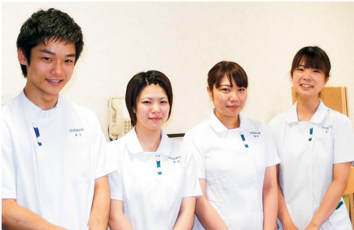
この笑顔を忘れずに

信州木曾看護専門学校3年（2期生）の生徒さんが病院実習に来ました。昨年からはまった病院実習は、1学年が3グループに分かれて順番に関連病院を回ります。7月上旬は、2番目のグループがこども病院の第2病棟・第5病棟・新生児病棟で看護実習を行いました。