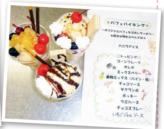
おやつ時間にパフェバイキングを行いました。 自分で好きなトッピングを選びパフェを作りました。

「しろくまニュースレター」のバックナンバーは 長野県立こども病院ホームページ ( http://nagano-child.jp/overview/public_relations ) でご覧になれます