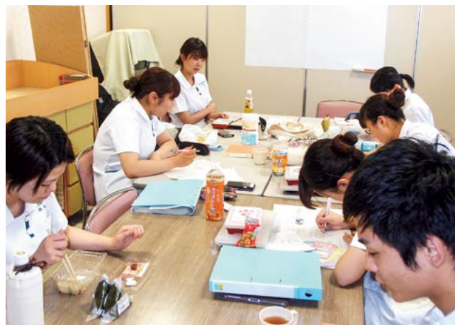
食事中も実習は続きます