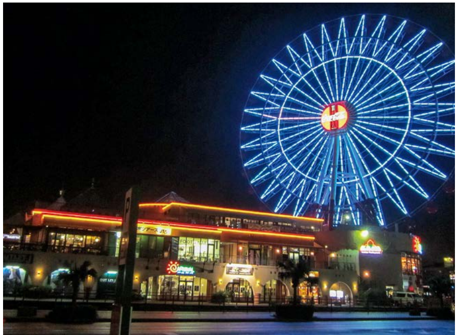
アメリカンビレッジでの夜景 大きな観覧車が目印です

先祖を迎える日)、14日、15日（ウークイ：先祖を送り出す日）に行きます。旧暦なので年によっても異なりますが、沖縄の人にとっては正月より大事です。ウークイの日には青年会がエイサーを踊って先祖を送り出します。