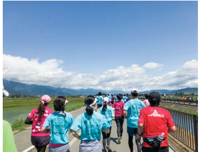
とても良い天気でした