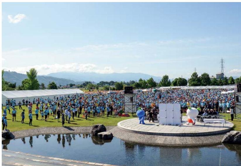
ランナー 5000人で開会式

や田んぼを眺めながら走ったり、夕方走っていると帰宅途中の高校生や同じくランニングをしている人が挨拶をしてくれたり、安曇野の良さを感じることができました。また、同僚の先生と一緒にランニングをしたのもいい思い出です。当日は朝から沿道に出て応援をしてくれる方々がたくさんいて、とても励みになりました。