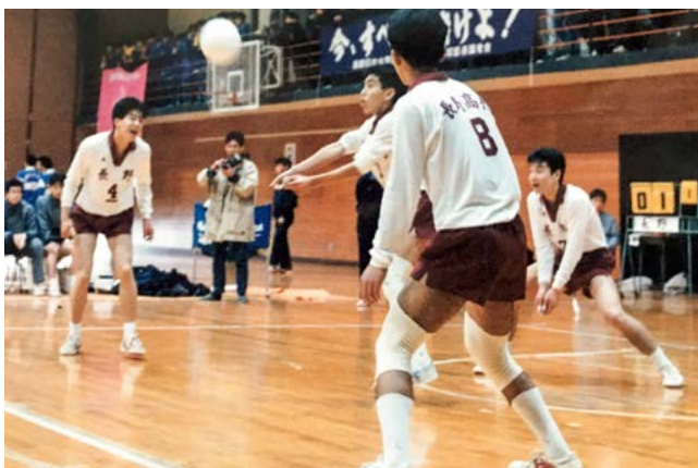
長野県高校バレーボール大会岡谷工業戦：28年前(左の4番が私)