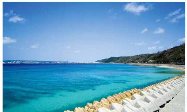
58号線からの海も綺麗です

さて沖縄の観光地を紹介します。那覇空港から出発しますと沖縄には国道58号線（通称ゴーパチ）というメインストリートがあり、観光地を回るには便利です。北部へ向かうその前に北谷町（ちやたんちょう…きたたにではありません）へ寄ってみてください。58号線から見える観覧車が目印で、アメリカンビレッジと呼ばれる映画館などの集まる商業施設があり、路上ライブも行われたりします。あのHYもライブを行ったことがあります。もともと基地があったこともあり、外国の方も多く異国情緒を体験できる町です。観覧車から景色を見るのもいいかと思います。なぜか古い師も大勢います。