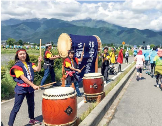
沿道の応援。励みになります

た人はどんどん前に進んでいき、その差を埋めるためには相当な挽回が必要。日々サボりがちな私は、時々マラソンをしながらそんなことを考えています。