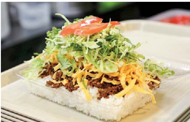
タコライス ボリューム満点です

沖縄にはたくさんの美味しい食べ物があります。沖縄そば、ゴーヤーチャンプルーなど美味しい食べ物がある中で、僕のお勧めは「タコライス」です。たまに間違われる方いますが、蛸はのっていません。メキシコ料理タコスの具をご飯の上に乗せたタコス+ライス=タコライスです。最近では本土の沖縄居酒屋でも出てくることもあります。