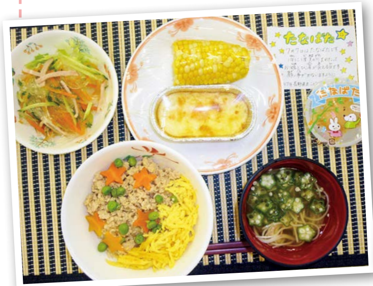
月と、にんじんで星を作りました。 そうめんとおくらもあり、病院の中でも季節を感じます。

こんにちは、栄養科です。7月7日は七夕でした。一年に一度、天の川を渡っており姫とひこ星が会える日です。皆さんの願い事がかないますように。