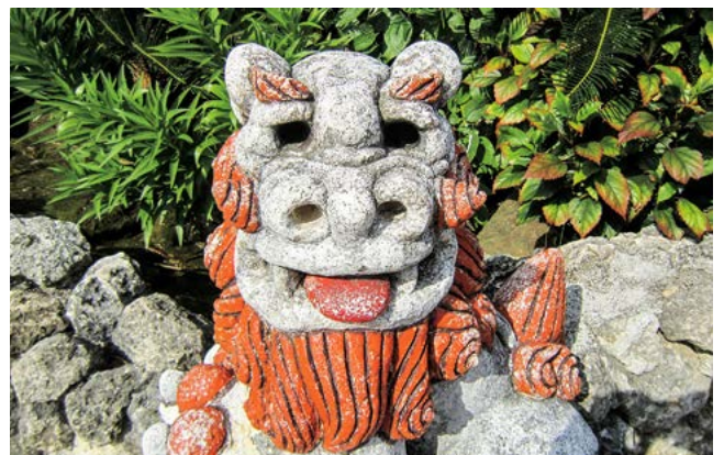
シーサー 性別があり、口が開いている方がオスです

今回沖縄の紹介ということで、ガイドブックに載っていないところというよりも個人的な観点から書かせていただきました。他にも書ききれない魅力的なところはたくさんありますので、行かれる方は声かけてください。