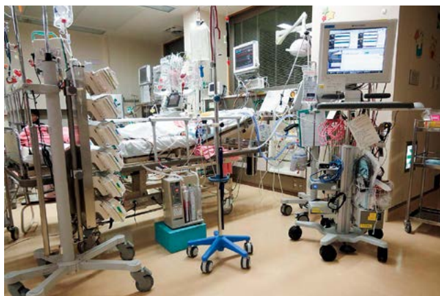
PICUでの脳波モニタリング

福) 大学院を出たとき、長野県で小児神経疾患のスペシャリストとして生きていくには、少なくともこども病院のスタッフができるだけ力がないとやっていけないだろうって思っていました。でも当時の僕にその力はなかった。どうすればいいか考えた結果、誰にも負けない柱を作ろうと、てんかんを学べる静岡てんかんセンターに行くことに決めました。