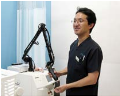
コンパクトなレーザー治療装置