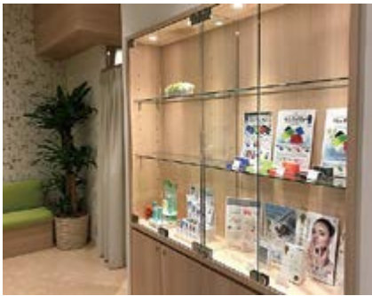
ショーケース（まだスペースがあります）