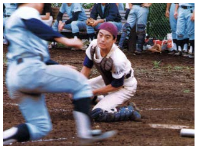
関東医科大学硬式野球リーグ戦(4年生)