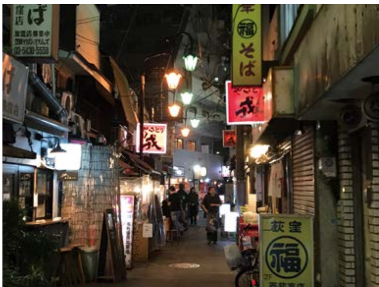
西荻窪のディープなゾーン

西荻窪にはチェーン店が少なく、個人商店が多いように感じます。西荻窪駅北口を出た大通りには、昔からある喫茶店や雑貨屋さん、最近新しくできたおしゃれな居酒屋、ライブハウスなどが並んでいます。反対側の南口を出るとディープな飲み屋さんが軒を連ねています。私はまだ足を踏み入れたことはありませんが、そろそろ突入してみたい！