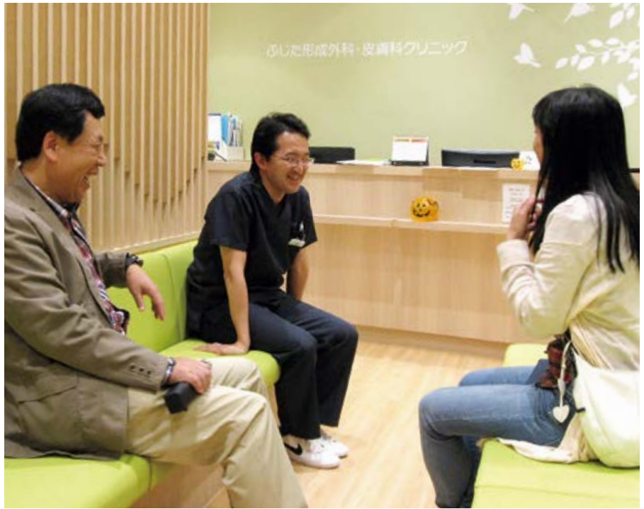
待合室でのインタビュー風景

たので、こども病院を退職してから1ヶ月の準備期間があるはずでした。しかし突然モールの開業が9月に早まってしまって…。実質の準備期間は2週間しかなかったんです。