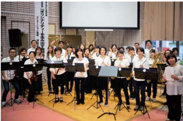
ちるくま音楽隊(病院祭でのコンサート後の集合写真:最後列左から2人目(トランペットを頭上に上げているのが本人))

中学、高校と続けた吹奏楽は、それは本気でやっていたね。大学になって運動もできるようになったので、また野球を再開しました。大学5年生の時はキャプテンになり東医体(東日本医科学生体育大会)で優勝しました。