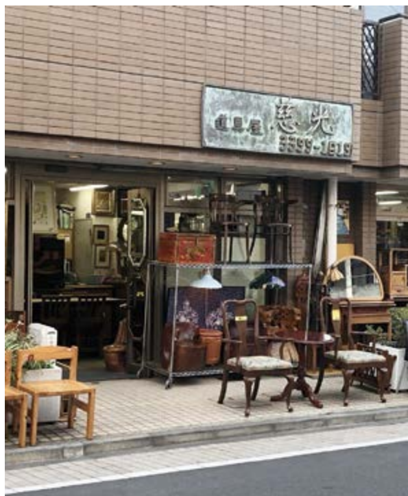
老舗アンティークショップ「慈光」

西荻窪といえば、アンティークショップががとても多い街として有名です。「西荻窪アンティークマップ」というものがあるほど。実家からも歩いて5分ほどの範囲に何軒かあります。また古本屋さんも多いので、古本屋巡りが好きな私の父にとっては、最高のお散歩ゾーンです。私も中学高校生の頃は、色んな古本屋さんに行っては、少しずつ漫画の全巻を集めていました。