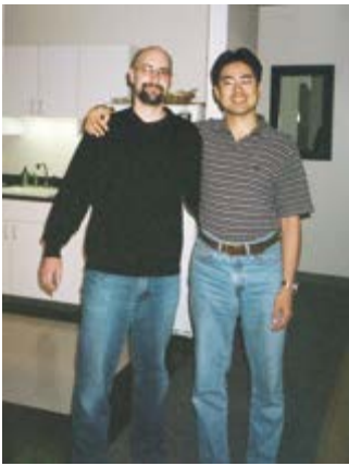
アイオワで知り合った 友達の自宅で