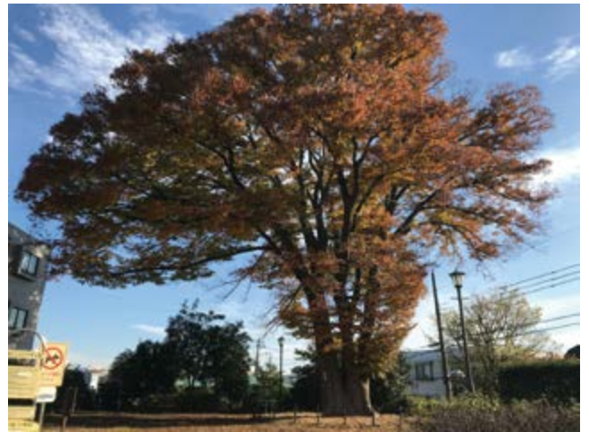
トトロの木～坂の上のけやき公園～

ほどよくオシャレ、ほどよくレトロな西荻窪。住みたい街No.1ではありませんが、こだわりを持って地元を愛する気持ちは負けてないかな?中央線沿線で交通の便