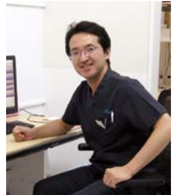
診察室にて（実はしらくまニュースレターの元編集委員です）