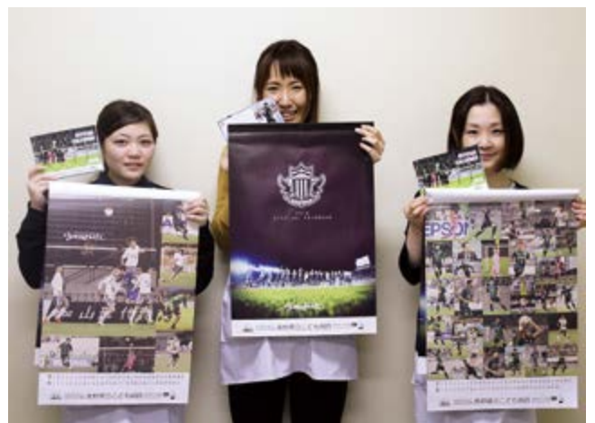
山雅カレンダーを手にして喜ぶファンサポーター▶

長野県立こども病院職員の親睦会は、会員の親睦を図る行事(歓迎会、納涼会、クリスマス会、送別会等)はもちろんのこと、パキスタンでの医療活動団体(ベジャワール会)へ寄付、松本山雅FCのパートナーカンパニーとして試合チケットの配布やこども病院仕様の2018年版カレンダーの注文販売を行なうなど、社会貢献を目指した活動も行なっています。