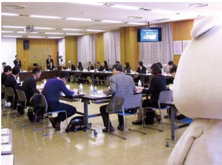
ちるくま君に見守られて会議は進む

標(医療の質を評価するための指標：ドクターカー出勤回数、等)については、基準になるデータと比較・分析しながら議論しました。各施設の取組みや小児病院ならではの質問は、事前アンケートにまとめて情報交換を行ないました。医療の質向上に向けて病院経営に役立つ意見を聞くことができ、有意義な研究会となりました。