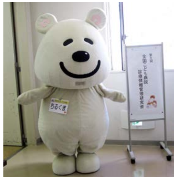
ちるくま君がご案内です