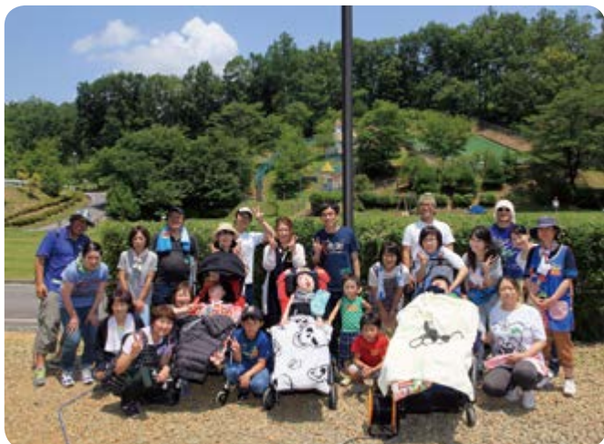
日帰りキャンプin筑北村