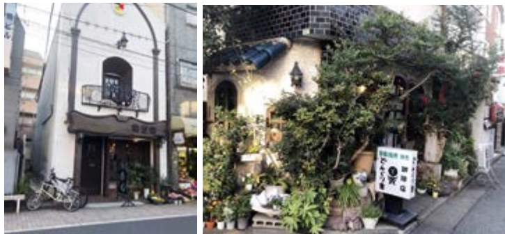
こだわりの喫茶店