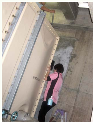
南棟の高架水槽 こんな感じで採水します(写真11)