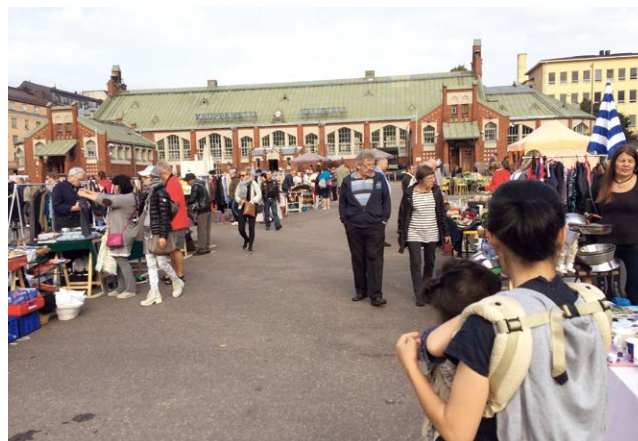
ヘルシンキの有名なフリーマーケット

ものを譲り合っていました。また、結婚してもしなくても、同性婚でも、子どもがいてもいなくてもいいんだ、人種だって違う養子だっていいんだ、何歳で大学行ってもいいんだ、いろいろな人生があり、いろいろな家族の形がありました。