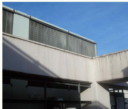
上に見えるのが 高架水槽です(写真8)