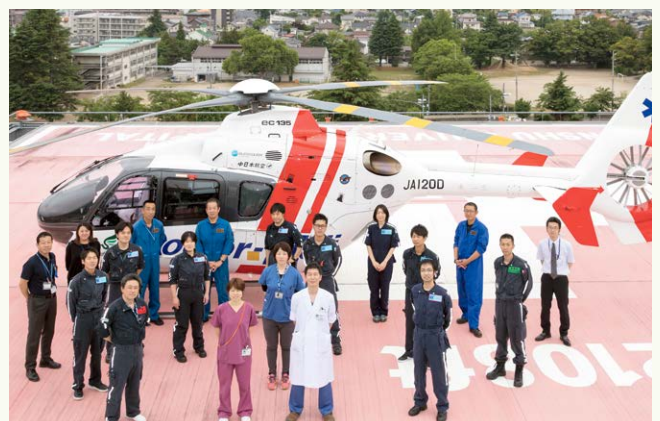
フライトスタッフ勢ぞろい 今後とも信州ドクターヘリの運航に ご理解ご協力をお願いいたします