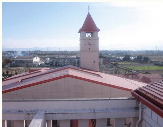
北棟の屋上から南棟方面を見る (写真12)