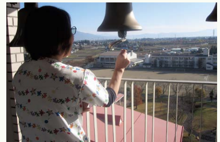
手動でカリヨンを奏でました(写真6)