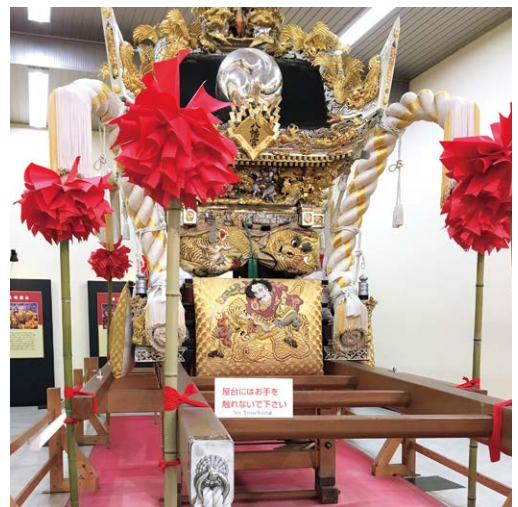
この神輿をぶつけ合います