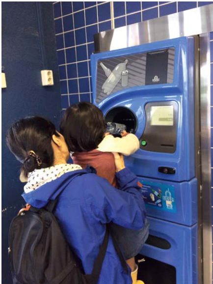
スーパーにあるペットボトル回収機 金券にかかります