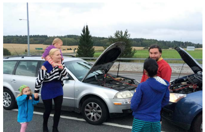
車のジェネレーターが故障し充電させてもらった