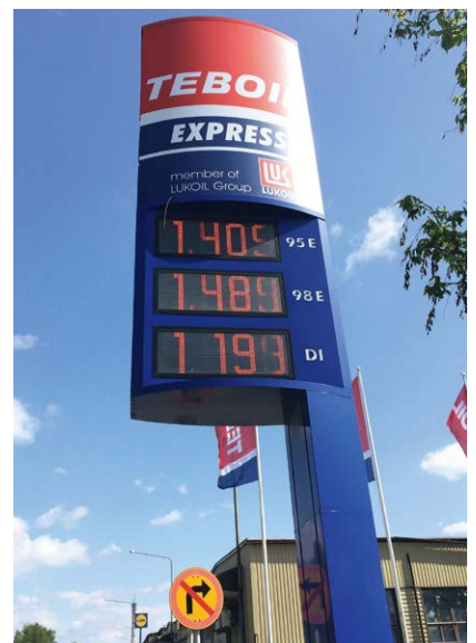
ガソリンも高い 1ユーロ130円

あとは物価の高さがこたえました。高級でもないレストランのランチでも2000円くらいして、クオリティは日本の半分くらいですし、病院の食堂もちょっと残念なランチに1000円弱かかります。ガソリンも高いです(燃費のいい日本車は人気です)。散髪屋も高いです。安いところは中東系の人が経営しているところで、どうも変で、妻からも「中東カット」と呼ばれ不評でした。日本より安いと思えるのは乳製品くらいかもしれませんが、たんぱく源である肉魚は結構高かったです。あとは、iitalaやArabiaなどのフィンランド食器、ヴィンテージの食器が(現地だから)いくら安いようです。妻はアンティークショップや中古品