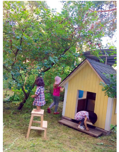
お隣さんが自作して 譲ってくれた子供用の小屋