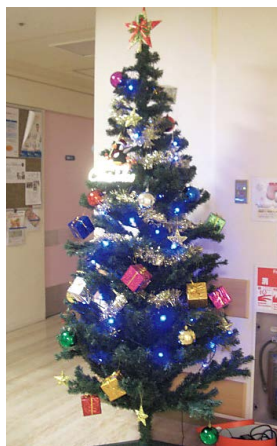
新生児病棟のツリー