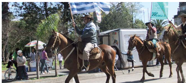
ウルグアイ国境の町Riviera