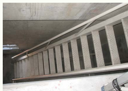
はしごのような急階段(写真2)

まずは、南棟3階にある秘密の階段のカギを開け、南棟の赤いとんがり屋根の塔のてっぺんに向かいます。初めは普通の階段なのですが、いよいよ塔の内部に入