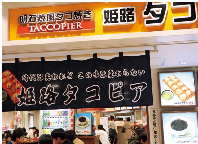
ノスタルジーを感じるたこ焼き屋「タコピア」