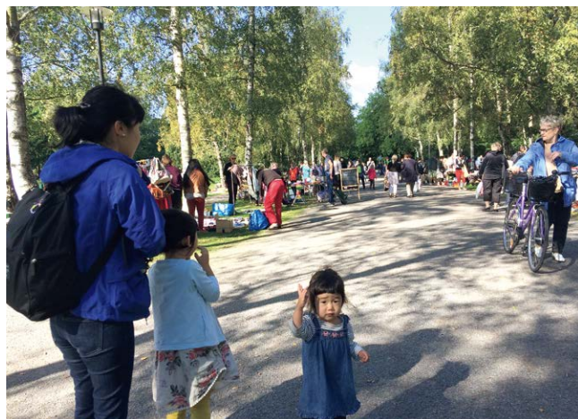
クリーニングデイというフリマイベント