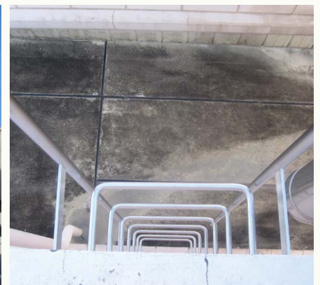
タンクに上るはしご なかなかスリリングです(写真9)