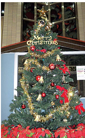
エントランスのツリー