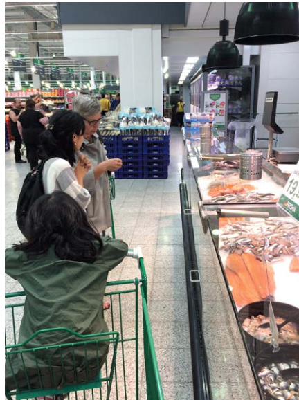
スーパーの鮮魚コーナー おばさんが調理方法を教えてくれた