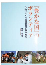
奥様の著書 『豊かな国』の ボランティア

*奥様は、保健師として南米ウルグアイで地域医療計画のボランティアをされていて、その様子を本にまとめておられます。