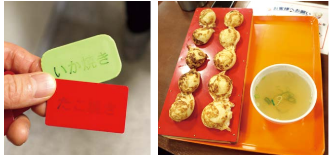
プラスチックの食券を手に並びます

ただ、時代のあおりをうけて値段が年々上がっております。幼少時代は280円、数年前までは360円だったのが今年はタコの値上げに伴い450円まで値段が上昇。まあ10個450円ならなんとかギリギリ許容範囲でしょうか。神戸・明石にたこ焼きのお店は数あれど、ここに勝る店なし。食感は抜群、味はそんなに期待し過ぎてはいけません、あくまでB級グルメですから。ちなみに本場・明石では「玉子焼き」と呼ばれ、流行りの揚げたカリッとさせたたこ焼きとは一線を画します、ご賞味ください。