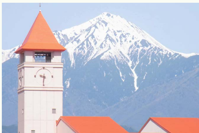
こども病院のシンボル 赤いとんがり屋根の塔(写真1)

こども病院のシンボルといえば、青い空に向かってそそり立つ赤いとんがり屋根の塔です。(写真1) ある初冬の午後、しろくまニュースレター編集委員と看護部の有志が、カリヨン(鐘)が鳴り響くあの塔や病院てっぺんの赤い屋根を探検してきました。