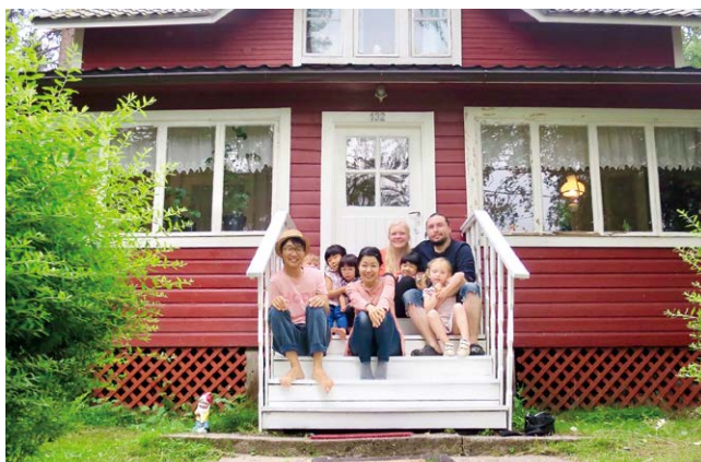
友人のサマーコテージ 築100年以上です

このような連載の機会を与えていただき、貴重な紙面をフィンランド色にさせてもらい、キートス パルヨン！（ありがとうございます）。少しでもフィンランドという国に興味を持っていただき、フィンランドに行ってみたいという方々が増えたら望外の喜びです。そして、最後に「さようなら」を覚えましょう。なんと「モイモイ！」です。モイで始まり、モイモイで終わるのです。ありがとうございました。