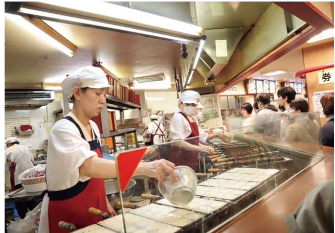
焼き職人のおば様方