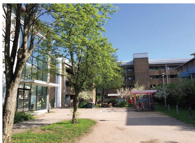
住んでいた大学の世帯用アパート