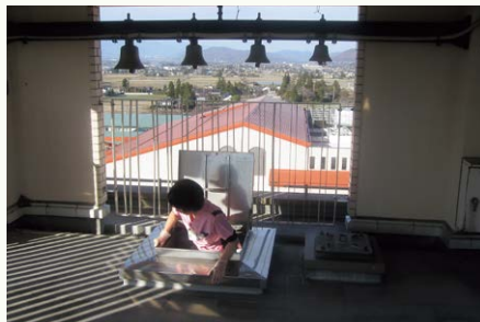
よっころしょっと!(写真3)