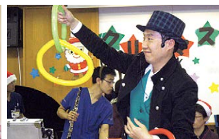
ポテトさんの バルーンショー