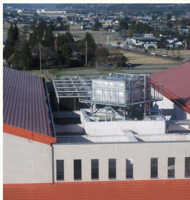
カリヨンの塔(南棟)からみた 北棟のてっぺん(写真7)

中央監視の皆さんは、病院のあらゆる施設の管理とともに、高い場所に登ったり、地下で作業をしたり、ホントに幅広い仕事です。高所や閉所恐怖症では務まりませんね。