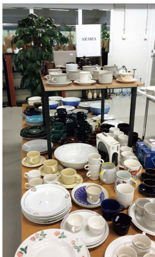
中古品店のArabiaコーナー

店を巡っては日本の通販サイトと見比べて、安い、安い!と興奮交じりに言っていました。結局私もシンプルなフィンランドデザインは好きになり、フィンランドでそれらを買付けしてそれを日本で売りさばくという余生を過ごしたいと夢見しています。