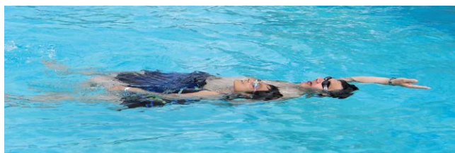
ウルグアイの温泉地