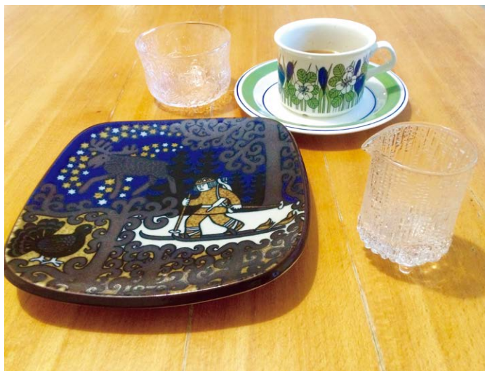
ビンテージ食器 価格は日本の3分の1