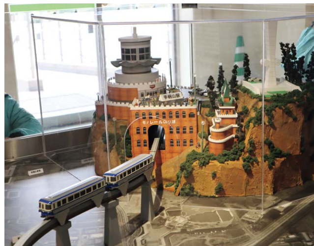
水族館にあるモノレール(の模型)