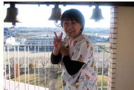
思わずピース(写真5)