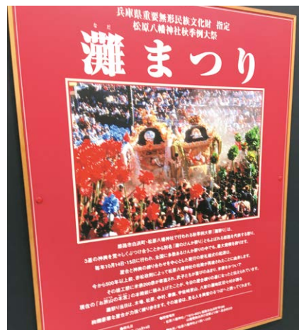
灘(けんか)祭りのポスター

京都・大阪はもう飽きたって方は少し足を延ばし、松本とはまた違った城下町・昭和を色濃く残した姫路にでもお立ち寄りください。