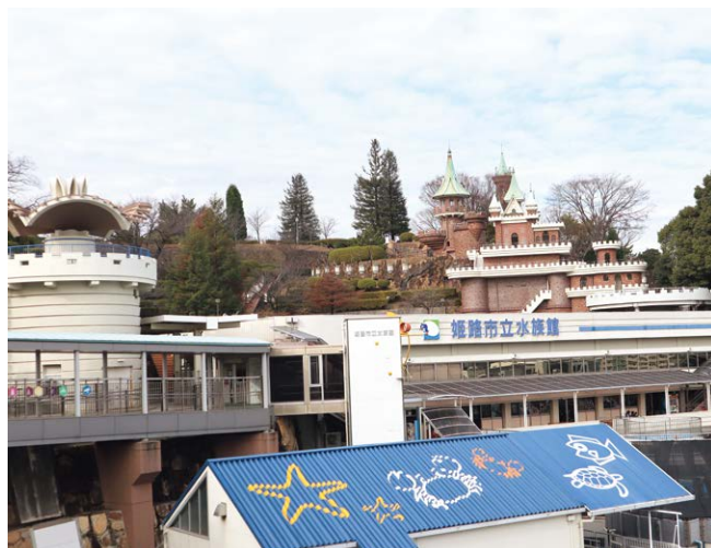
山の上の姫路市立水族館

当時走っていたモノレールの駅舎が併設されており、モノレール博物館は水族館の順路にもなっているため追加料金なしで見学できます。取り壊すのも面倒なので、あるものは使おうとリノベーション&リノベーションで現在の形になっております。猥雑な建築物の集合体、こちらも一見の価値ありです。