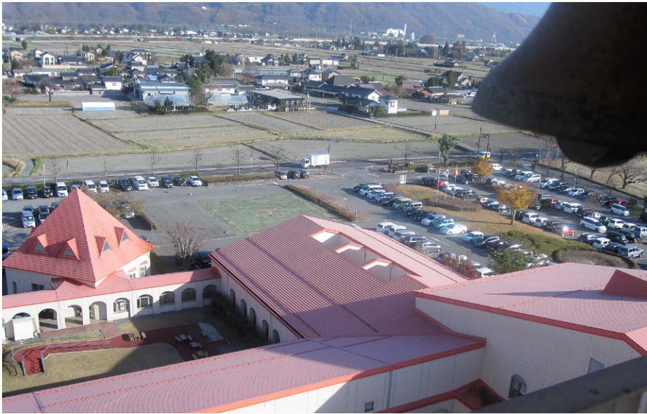
眼下に広がる 雄大な景色(写真4)