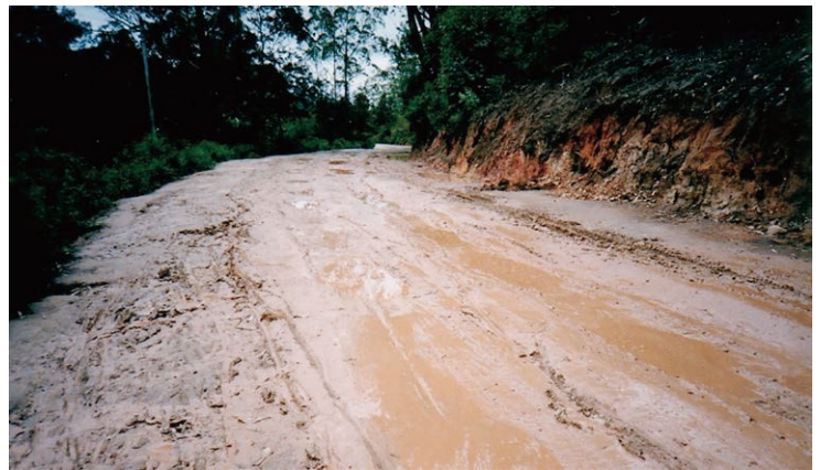
【写真5】泥道：雨が降ると途端に泥沼と化してしまいます。車もぬかるみにはまると動けなくなり、みんなで車の後ろを押す光景を目にします。