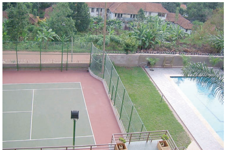
【写真7】高級アパートのプールとテニスコート：周囲が断水でもこの手のアパートは井戸を持っており、地下水を汲み上げて水を供給しています。ですから、いつでもプールで泳げます。アパートの外壁（道に面しているプールとテニスコートの壁）には有刺鉄線が張ってあります。