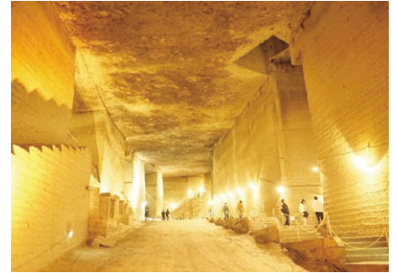
大谷石の地下採掘場

が、実はカクテルとジャズの町ともいわれています。有名どころは「パイプのけむり」というお店で、全国優勝したバーテンダーさんもいます。