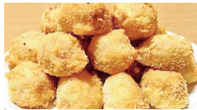
芋フライ 家庭バージョン