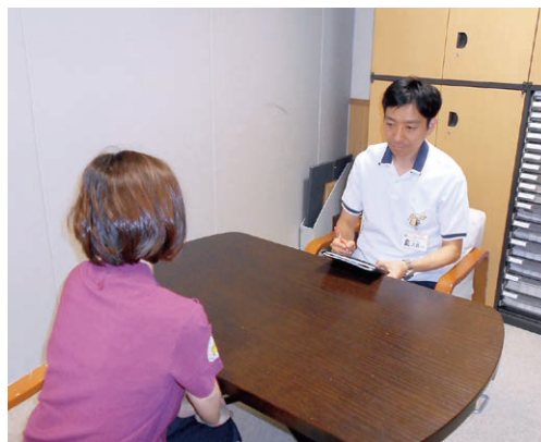
カウンセリングは医師の指示によっておこないます。

ストレスが関係するのは病気だけでなく、学校・友人関係・発達上の問題・家庭生活での親子関係の悩みなど多岐にわたります。こういった問題もこころの支援科でご相談をお受けします。