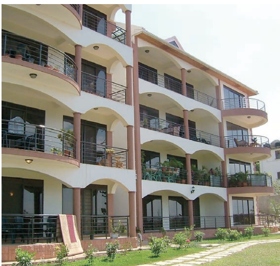
【写真6】都市部の高級アパート