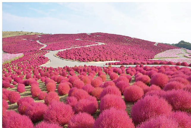
ひたち海浜公園 コキア