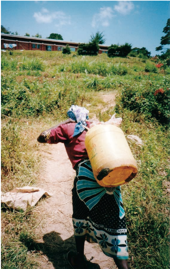
【写真3】水汲みおばさん：アフリカでは水汲みは例外なく女性の仕事です。私がケニアに赴任しているときに、自分の水は自分で汲もうと思って水汲み場に行こうとしたところ、周囲の男性や同僚に「それは女性のすることだから男はやるな」と止められました。女性蔑視という意味ではなく、男性・女性の仕事が明確に分かれているといえるでしょう。一般的にアフリカの女性は働き者ですが、男性はどちらかといえばダラーとしている人が多いような印象です。