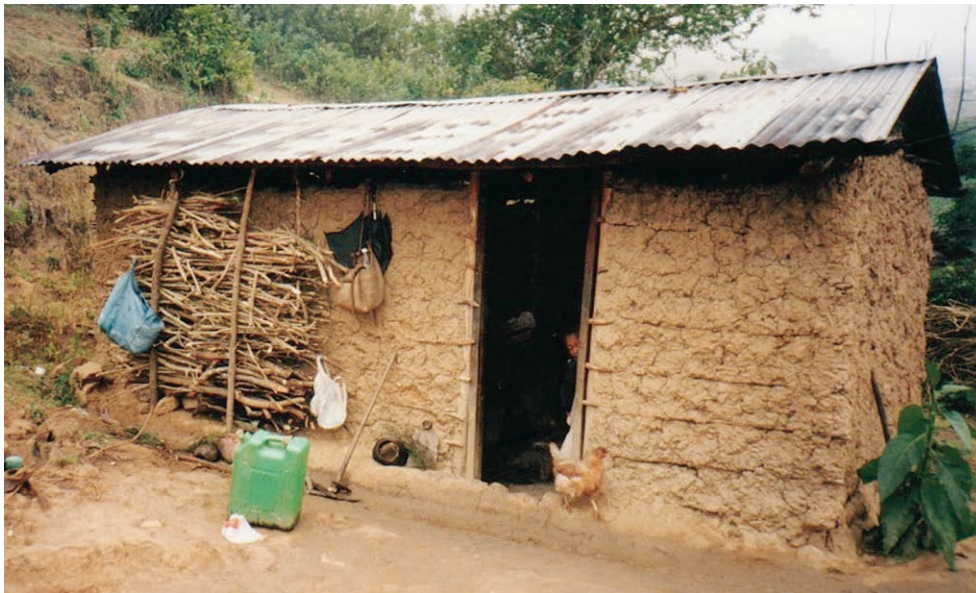
【写真2】生徒の家：家の周囲には鶏が放し飼いにしており、クリスマスや特別な祝い事、賓客のもてなしのときに、絞めて食卓に上ります。ですから、アフリカの多くの地域でもてなしの席に鶏肉が出てきたら、それは最高のもてなしを意味しています。日本で鶏肉は最も安いものですが、アフリカでは鶏肉は最も高級なものとなまされています。