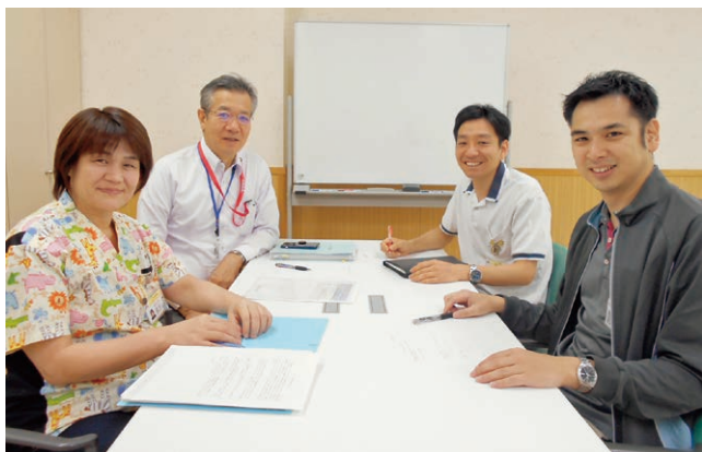
みんなで話し合いながら仕事しています。

こども病院には、たくさん子どもたちが通院や入院をしています。でも、病院が大好き！と思う子どもは少なく、治療に一生懸命に前向きに取り組みながらも、「病院に行くのは嫌だな～」「注射が怖いな～」と、こころの中にストレスを抱えていることがあります。