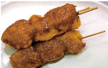
芋フライ お店バージョン

私の生まれ故郷です。「佐野プレミアムアウトレット」と「佐野厄除け大師」があります。私も厄年のお祓いをしてもらいましたが、効果はあったような、なかったような。佐野のグルメといえば芋フライと佐野ラーメン。芋フライはジャガイモを湯がいて衣をつけて揚げただけのシンプルな食べ物です。お店で売っているものは衣が柔らかくソースたっぷりですが、家庭ではサクッとした仕上がりで、こっちが本当の芋フライだと思っています。佐野ラーメンは縮れ麺が特徴で、スープはあっさりです。