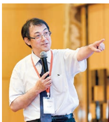
中国の学会での講演

廣) 私は人づきあいが苦手なので、期待に応えられるかなあ。部屋にこもってパソコンをいじっていたり、患者さんを診ていたりするのはすごく好きだけど、あまり仕事以外での人とのコミュニケーションは好きじゃなくて。何年も診療してきて今の立場になったけど、これが本当に私のやりたいことなのかというと、どうかなあとも思います。