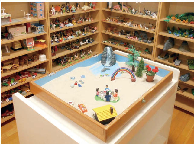
お子さまの様子によって、箱庭療法をおこなうこともあります。

ストレスは子どもだけでなく、ご家族も同様です。子どもの病気が良くなると信じ、願っていても、こころのどこかで「大丈夫だろうか」と不安に感じ、「風邪をひかせないよう私が気をつけないと」と、四方八方にアンテナを張り巡らせ、気を張っていることが多いと思います。