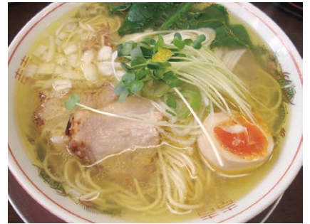
竹末食堂のラーメン

私が勤務していた自治医大がある他は、特に何も名所はございません。ただ、「竹末食堂」だけご紹介させていただきます。私は長野に来てからも、ここ以上に美味しいラーメンにはまだ出会っていません。帆立のだしを使ったスープで、メニューは「スペシャル」、「あっさり」、「こってり」があります。しつこすぎないけどコクのあるスープに病みつきになります。