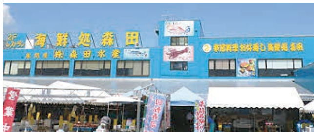
那珂湊おさかな市場 森田水産

その日水揚げされた新鮮な魚介類を販売しているだけでなく、お寿司屋さんも軒を連ねています。土日は11時までに行かないと激込みです。「森田水産」の2階にある回転寿司がとにかくおいしい。ネタが大きくて新鮮です。