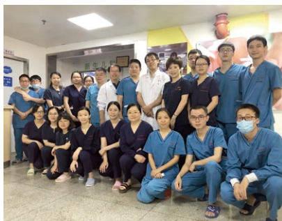
中国のこども病院