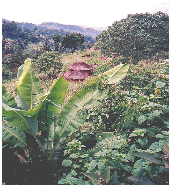
【写真1】ケニアの田舎の家: 写真中央に草葺きのとんがり屋根の家が2棟あります。その周囲には、メイズ(白いトウモロコシ)やコーヒー畑があります。手前にある大きな葉の植物はバナナです。

「アフリカの家」と聞いてどういう家を想像するでしょうか? 「草原の中にポソソとある粗末な草の家」を思い浮かべる方が多いかもしれません。アフリカの草原地帯(サバンナ)の中で昔ながらの狩猟生活をしている人たちはいますがその数は少なく、多くの人たちは定住しています。そして地方ならば小規模な農業を営み、都市部であれば付近の職場で働くのが一般的です。写真1はケニアの典型的な地方の風景です。乾燥させた草(日本のスキに似たような草)で葺いた円形の屋根の家(ハットと言います)の周囲には、バナナやアボカドの木が植わっています。その近くには小規模のメイズ(白いトウモロコシ)畑やコーヒー畑があります。