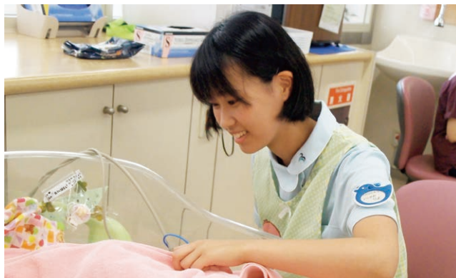
実習前のイメージと違ってました