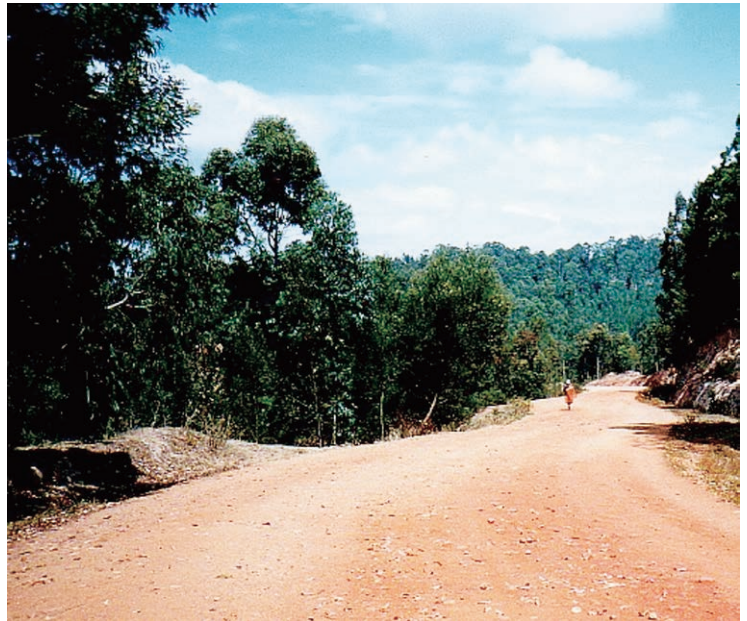
【写真4】田舎の道：主要幹線道路は舗装されているところが多いですが、それ以外の道はほとんどが未舗装です。