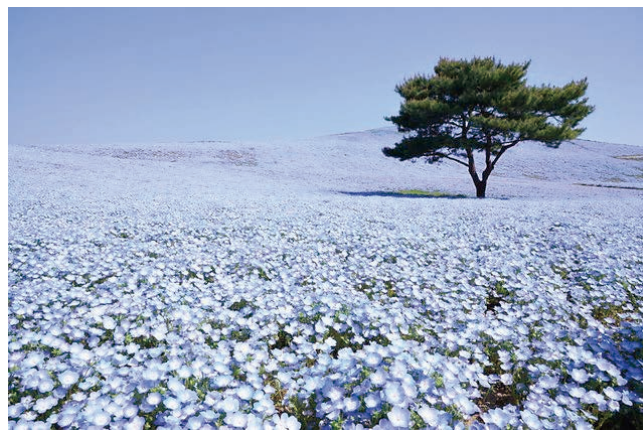
ひたち海浜公園 ネモフィラ

春はネモフィラ、秋はコキアがそれぞれ青と赤の絨毯のように咲き誇り、テレビでも紹介されています。インスタ映えのするスポットとして有名になって、県外からもたくさん観光客が押し寄せます。なんと朝7時頃から駐車場に入るのに行列です。ROCK IN JAPANで訪れた方もいらっしゃるのではないのでしょうか。