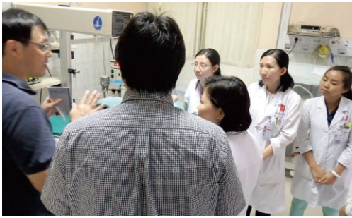
カンボジアの 病院で指導