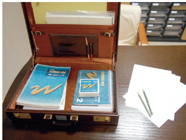
心理検査の道具。患者さんへの関わりを考えるときの大事な資料となります。

こころの支援科には、臨床心理士、リエゾン精神看護専門看護師という専門職がいます。他部門の医療スタッフと協力しながら、こころの健康を支えるお手伝いをさせていただきます。ストレスやお悩みがあれば、まずはじっくりお話を聞かせてください。