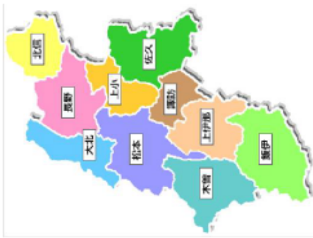
長野県の医療圏域 (長野県HPから)